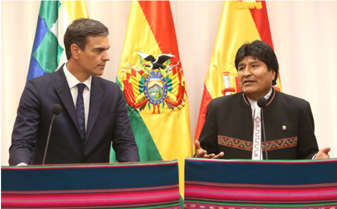
El presidente de España, Pedro Sánchez y de Bolivia, Evo Morales, durante sendas intervenciones, en el transcurso de la visita oficial de Sánchez a Bolivia. Bolivia.-29/08/2018.

28/06- 4/07-2016: visita del director general de Cooperación de Islas Baleares Antoni Servera Saletas para asistir al II Foro de desarrollo y economía local en América Latina y Caribe. 19/21-06-2016: visita del expresidente Zapatero a Cochabamba (Tiquipaya), con motivo de Encuentro Internacional "Por una ciudadanía universal: un mundo sin muros", como invitado internacional por el Gobierno de Bolivia.