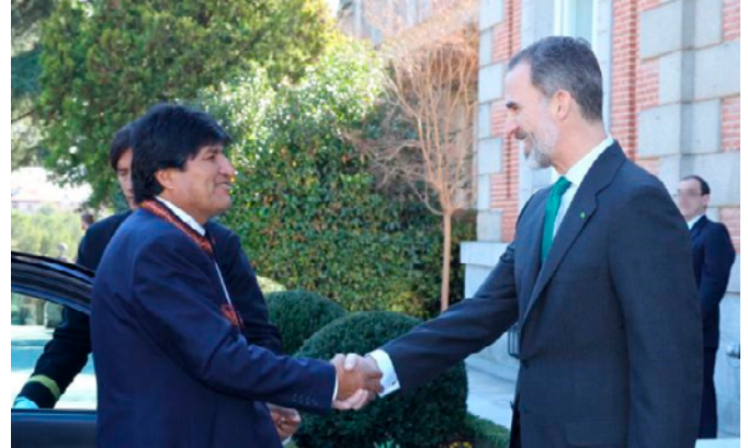
SM el rey Felipe VI recibe el saludo de su excelencia el presidente del Estado Plurinacional de Bolivia, Sr. Evo Morales Ayma, a su llegada al Palacio de La Zarzuela Madrid, 16.03.2018.

La Cooperación Española con Bolivia se remonta a hace más de 30 años, con una importante presencia de actores. Muestra de ello es la existencia de tres Unidades de Cooperación en el Exterior (UCE) en Bolivia: una Oficina Técnica de Cooperación en La Paz, un Centro de Formación en Santa Cruz de la Sierra y el Centro Cultural de España en La Paz, que refuerza el compromiso con la cooperación intercultural entre ambos países.