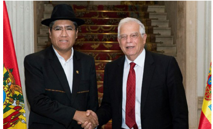
El ministro español de Asuntos Exteriores, Unión Europea y Cooperación, Josep Borrell junto a su homólogo boliviano Diego Pary. Madrid.- mayo de 2019

23/24 de octubre 2017: visita de la ministra de Culturas y Turismo a Sra. Wilma Alanoca, a Madrid durante la cual se reunió con secretario de Estado de Cultura y secretaria de Estado de Turismo con quien firmó un MOU de cooperación en materia turística.