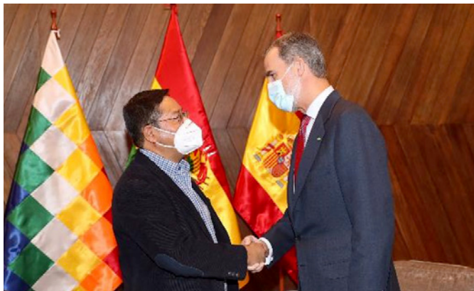
SM Rey de España, recibido por el nuevo presidente de Bolivia, Luis Arce.- Bolivia, noviembre de 2020.