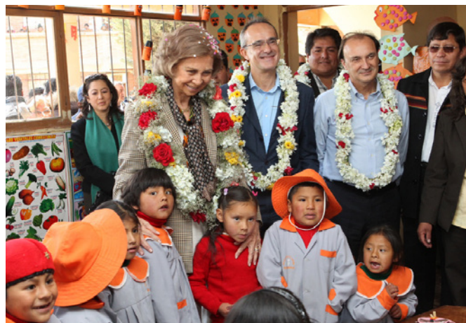
S.M. la reina doña Sofía, junto al anterior embajador de España, Ángel Vázquez, y el anterior secretario de estado, Jesús Gracia, durante su visita la Unidad Educativa "España" en el marco de su viaje oficial a Bolivia en octubre de 2012.

Las relaciones entre la UE y Bolivia se desarrollan en el marco del mecanismo denominado Diálogo de Alto Nivel, que se celebró por última vez en La Paz, en noviembre de 2018. Bolivia es el segundo mayor receptor de la cooperación bilateral de la UE en América Latina, con un importe de 281 millones de euros para el período 2014-2020.