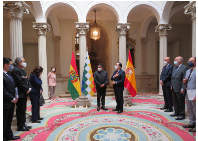
EL ministro de Asuntos Exteriores y de Cooperación junto al vicepresidente de Bolivia. Visita a Madrid en septiembre de 2021.

El Tribunal Constitucional Plurinacional (elegido por sufragio universal) es el encargado de velar por la supremacía y cumplimiento de la Constitución.