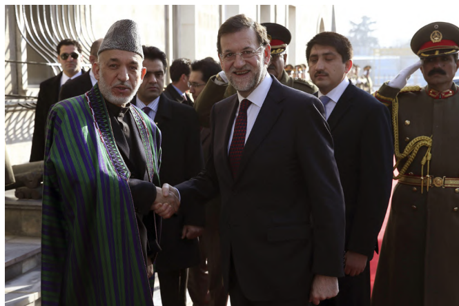
El anterior presidente del Gobierno, Mariano Rajoy, saluda al entonces presidente afgano, Hamid Karzai, durante su visita a Kabul en diciembre de 2012 para reunirse con las tropas españolas.