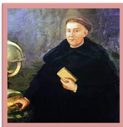
Retrato de Fray Martín de Rada

https://dbe.rah.es/biografias/33509/martin-de-rada-cruzat