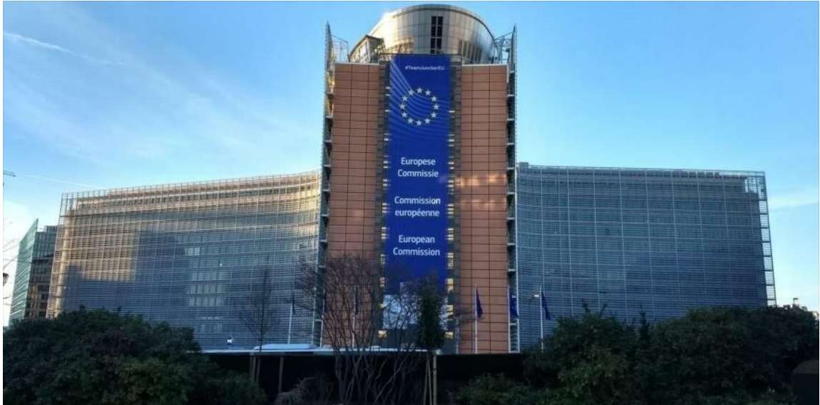
Edificio Berlaymont (Comisión)

Actualidad y seguimiento de las Políticas Sociales de la Unión Europea