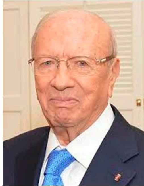
Presidente de la República: Beji Caid Essebsi.

Las próximas elecciones legislativas y presidenciales están previstas para 2019.