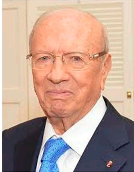
Presidente de la República: Beyi Caid Essebsi.

Quedaron en la oposición otras fuerzas como Machru Tunis, una escisión de Nida Tunis liderada por un ex consejero del Presidente de la República, Mohsen Marzuqi, o el Frente Popular, en el extremo izquierdo del arco parlamentario, liderado por Hama Hamami. En junio de 2017 se consumó una nueva escisión de Nida Tunis, integrándose varios de sus diputados en un nuevo partido, Túnez Primero. Fuera de la ARP, el ex primer ministro tecnocrático Mehdi Yoma lanzó en 2017 un nuevo partido, la Alternativa de Túnez. El ex presidente Moncef Marzuqi también ha tratado de impulsar un partido, la Voluntad de Túnez. El marcado retroceso de Al Takatul, que fue otro de los pilares de la transición, hace que el espacio