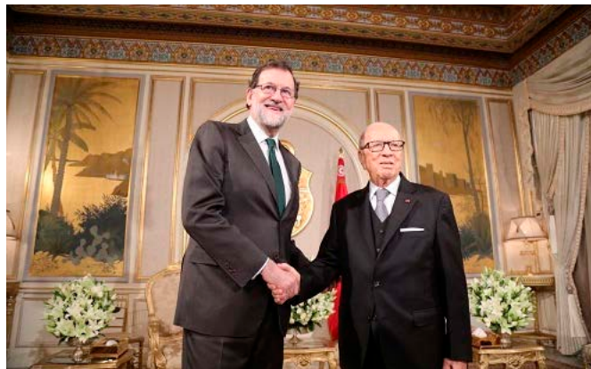
Mariano Rajoy, anterior Presidente de Gobierno, junto al presidente de la República Tunecina, Béji Caïd Essebsi.- en Túnez, febrero 2018.

• FIDA: Programa de desarrollo agropastoral y promoción de las iniciativas locales