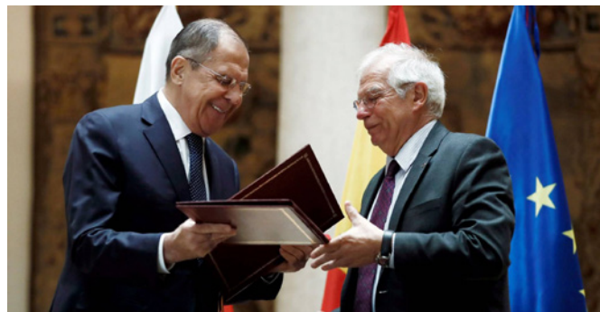
Encuentro entre el entonces ministro de Asuntos Exteriores, Unión Europea y Cooperación, D. José Borrell y su homólogo ruso, Serguei Lavrov, con motivo de la reunión para consultas bilaterales en Madrid. - 06-11-2018.

Tras un año de recesión (2015) y otro de crecimiento mínimo (2016), el PIB creció un 1,6% en 2017 y un 2,3% en 2018, año en el que se superaron las previsiones de crecimiento en 5 décimas. El crecimiento es impulsado,