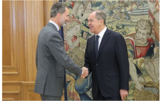
SM el Rey recibe el saludo del ministro de Asuntos Exteriores de la Federación de Rusia, Serguéi Víctorovich Lavrov. Madrid, 6-11-2018

Por su parte, el distanciamiento entre Rusia y EEUU, ya perceptible durante el mandato del presidente americano, Barack Obama, se ha acrecentado tras las investigaciones que apuntan a una injerencia rusa en el proceso electoral presidencial de EEUU de 2016 que aupó a Donald Trump a la presidencia, y