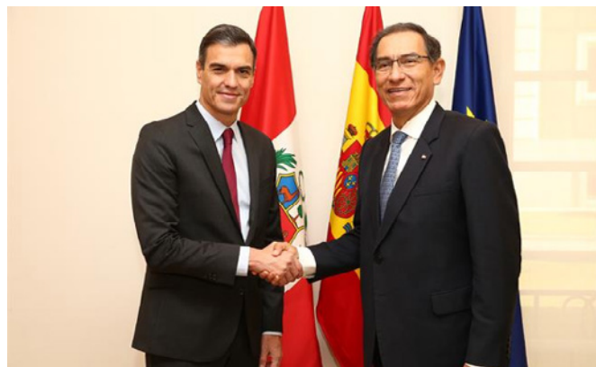
El presidente del Gobierno, Pedro Sánchez, recibe en La Moncloa al presidente de Perú, Martín Vizcarra, en el marco de la visita de Estado que realiza el mandatario peruano a España. La Moncloa, Madrid - 28/02/19.

SSMM los Reyes realizaron un viaje de Estado en noviembre de 2018, y SSAARR los Príncipes de Asturias en 2010.