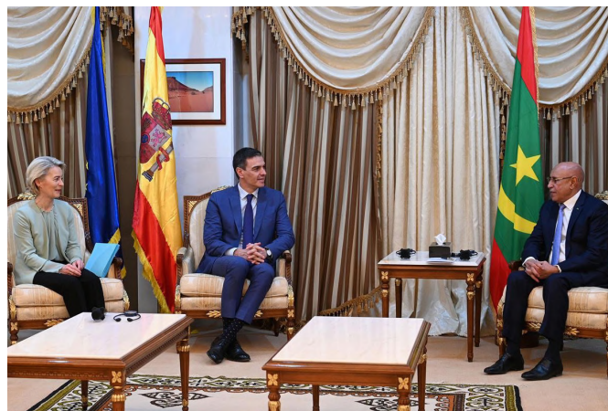
La presidenta de la Comisión Europea, Ursula von der Leyen y el presidente del Gobierno, Pedro Sánchez, junto al presidente de la República Islámica de Mauritania, Mohamed Ould Ghazouani, durante una visita conjunta a la República Islámica de Mauritania. Nuakchot (Mauritania) - 8.2.2024.