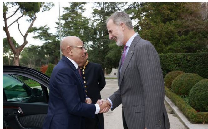
Su Majestad el rey Don Felipe junto al presidente de la República Islámica de Mauritania, Mohamed Ould Cheik El Ghazouani, en Madrid, 5 de diciembre 2024.

Teléfono de emergencia consular: (+222) 46 83 36 62