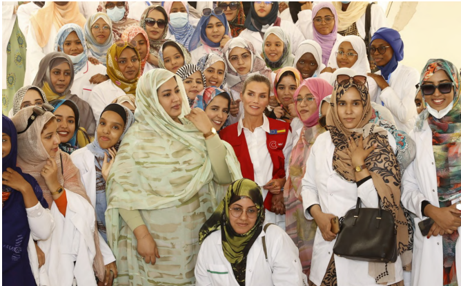
La Reina junto a Su Excelencia la Primera Dama de la República Islámica de Mauritania acompañadas de estudiantes de la Facultad de Medicina de la Universidad de Nuakchot (República Islámica de Mauritania), 01/06/2022.-Foto: @ Casa de S.M. el Rey

Datos en Millones de euros Fuente: FMI, marzo 2025