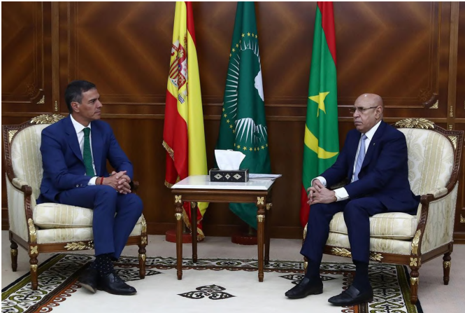
El presidente del Gobierno, Pedro Sánchez, y el presidente de la República Islámica de Mauritania, Mohammed Cheikh El Ghazouani durante la reunión que han mantenido en Nuakchott, el 27 de agosto 2024.