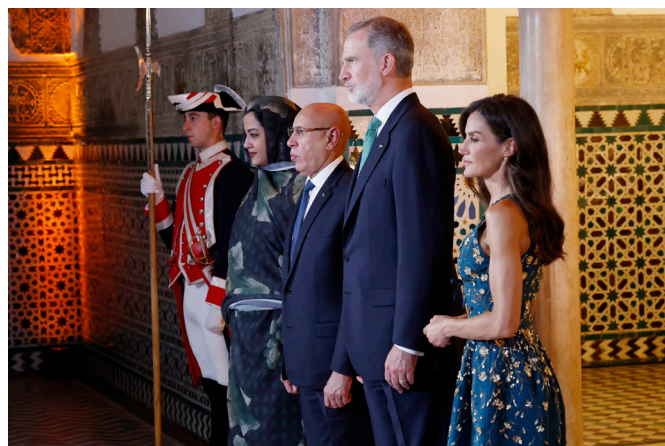
Sus Majestades los Reyes de España junto al presidente de la República Islámica de Mauritania, Mohamed Ould Cheik El Ghazouani y primera dama de Mauritania, en Sevilla, 29 de junio 2025.-Foto: (Pool Casa Real)

Gobernador del Banco Central , Sr. Mohamed Lemine Dhehby.