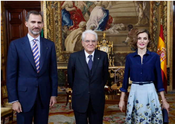
Encuentro de Sus Majestades los Reyes junto al presidente de la República Italiana, Sergio Mattarella, con ocasión de su visita a España. (mayo 2015)

españoles un 3,6% con respecto al mismo periodo del ejercicio anterior, registrando los 3.049.000 turistas.