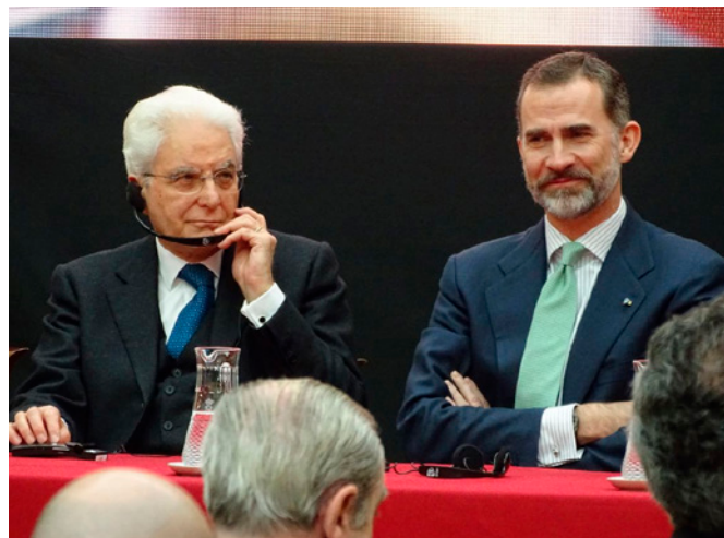
SM el rey de España, Felipe VI junto al presidente de la República Italiana, Sergio Mattarella, durante el XI Symposium Cotec Europa, que tuvo lugar en el Palacio Real de el Pardo (Madrid).- 10/02/2017.

Tras abandonar el Parlamento en 2008, en 2009 fue designado miembro del Consejo de Presidencia de la Justicia Administrativa del que luego pasaría a ser vicepresidente.