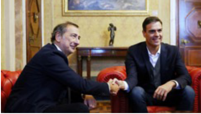
El presidente del Gobierno español, Pedro Sánchez, junto al alcalde de Milán, Giuseppe Sala, en la sede del Ayuntamiento de la ciudad. Milán 27/10/2018