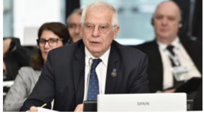
El anterior ministro de Exteriores español, D. Josep Borrell en el Consejo Ministerial OSCE. Milán 6 de diciembre de 2018.