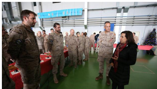
Margarita Robles, ministra de Defensa charla con los militares en la base aeronaval de Sigonella, en Sicilia para visitar a los militares españoles que participan en la 'Operación Sophia'.- Diciembre 2019.- @EFE

Las operaciones españolas más significativas en Italia en 2018 fueron: comercio al por mayor e intermediación del comercio, excepto de vehículos de