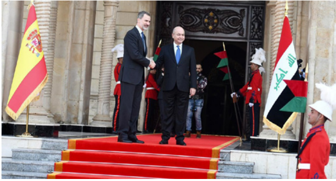
El presidente iraquí Barham Salih, junto al rey español Felipe VI en Bagdad, Irak.-30 de enero de 2019.

En 2015, se destinaron 1'5 millones de euros a Irak. Se apoyó al Comité Internacional de la Cruz Roja con un monto de 1.000.000 euros con el fin de responder al llamamiento de emergencias del CICR para dicho país, así como al Programa Mundial de Alimentos con 300.000 euros para dar asistencia de emergencia para la población afectada por el conflicto en Irak y a Cáritas España con 200.000 euros para dar respuesta de emergencia de refugio y agua, saneamiento e higiene, a población desplazada y de acogida especialmente vulnerable en Kirkuk.