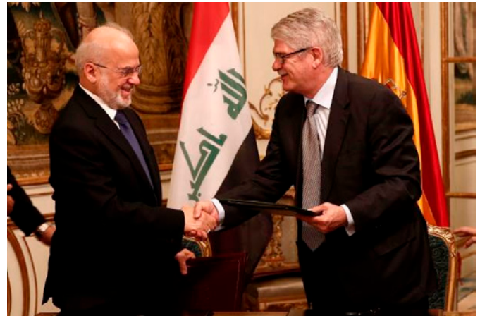
Encuentro entre Alfonso Dastis, anterior ministro de Asuntos Exteriores y de Cooperación y el entonces ministro de Asuntos Exteriores, Al Jaafari. - Mayo 2017 en Madrid.

Un primer contingente humanitario español llegó a Irak en abril de 2003. En julio, el cometido asignado al contingente español pasa a ser “misión de paz” y queda encuadrado en una división multinacional bajo mando polaco con el objetivo de garantizar el orden en la zona central-sur del país (chii) con bases en Diwaniyah y Kerbala.