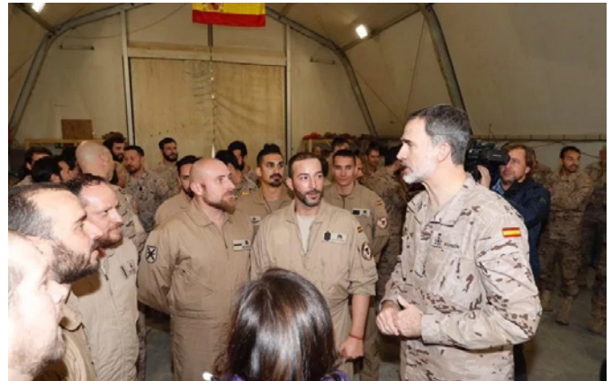
SM el Rey conversa con varios miembros del contingente español desplegado en Irak, Bagdad, 30.1.2019

-Ayuda bilateral a Jordania para los desplazados víctimas del conflicto.