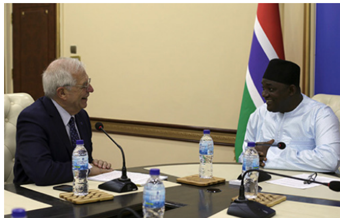
El entonces ministro Borrell fue recibido en Banjul por el presidente de Gambia, Adama Barrow.

En febrero de 2018, Gambia reingresó en la Commonwealth, que había abandonado en 2013.