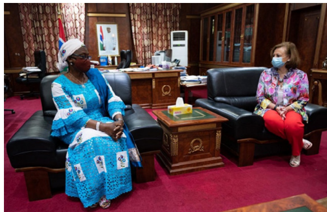
Encuentro entre la vicepresidenta de Gambia, Isatou Touray y la secretaria de Estado de Asuntos Exteriores y para Iberoamérica y el Caribe, Cristina Gallach, con motivo de su viaje a Gambia. Diciembre 2020

Ministro de Juventud y Deporte: Bakary Badjie