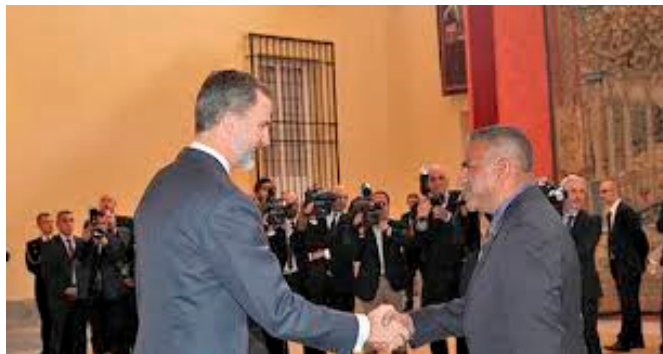
Su majestad el rey Felipe VI saluda al entonces ministro de Industria, Comercio y Turismo Tierras y Recursos Minerales, Faiyaz Koya, con motivo del lanzamiento del Año Internacional de Turismo Sostenible para el Desarrollo 2017 de la Organización Mundial del Turismo de las Naciones Unidas.- Enero 2017.

No hay antecedentes de visitas oficiales, más allá de la de los embajadores de España con sede en Nueva Zelanda para presentar sus cartas credenciales al gobierno de Fiji.