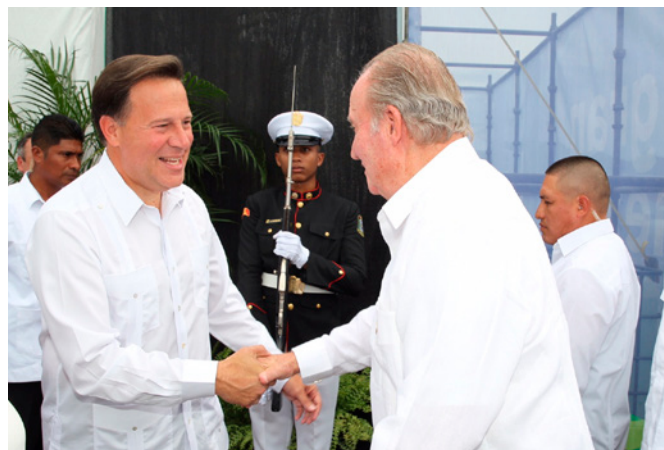
Su Majestad el Rey Don Juan Carlos recibe el saludo del entonces presidente de la República de Panamá, Juan Carlos Varela, a su llegada a las esclusas de Cocolí.-Panamá, 26.06.2016.

El stock de inversión panameña en España ascendió a 398,3 M EUR en 2016 (último dato publicado), lo que representaría un 51% más que los 263,5 M