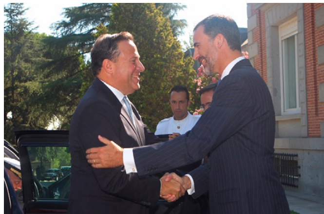
SM el Rey recibe al presidente de Panamá, Juan Carlos Varela, a su llegada al Palacio de La Zarzuela. - Madrid, 08.09.2014

Nito Cortizo asumió la presidencia de la República el 1 de julio de 2019 iniciando una agenda política de la transición.