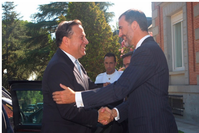
SM el Rey recibe al presidente de Panamá, Juan Carlos Varela, a su llegada al Palacio de La Zarzuela.- Madrid, 08.09.2014

Cursó estudios primarios en el Colegio Javier y secundarios en el Colegio de La Salle en Nicaragua. Realizó estudios en la Academia Militar de Valley Forge. Obtuvo su título de Administración de Empresas en la Universidad de