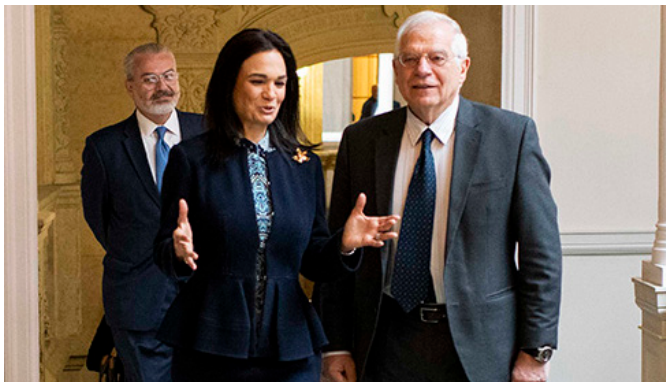
La entonces ministra de Relaciones Exteriores de Panamá Isabel de Saint Malo y su anterior homólogo Josep Borrell, en el Palacio de Viana. 24-04-2019.

misma pretende Erradicar la pobreza, Construir resiliencia de las personas y comunidades, Reducir las desigualdades, Defender los derechos humanos y libertades fundamentales, Promover un crecimiento económico inclusivo, Conservación del planeta y la lucha contra el cambio climático.