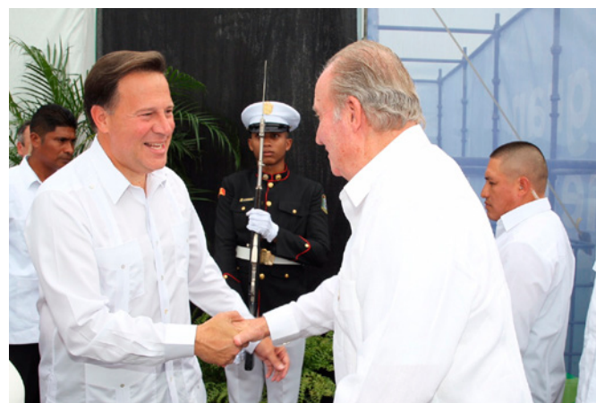
Su Majestad el Rey Don Juan Carlos recibe el saludo del entonces presidente de la República de Panamá, Juan Carlos Varela, a su llegada a las esclusas de Cocolí.-Panamá, 26.06.2016.