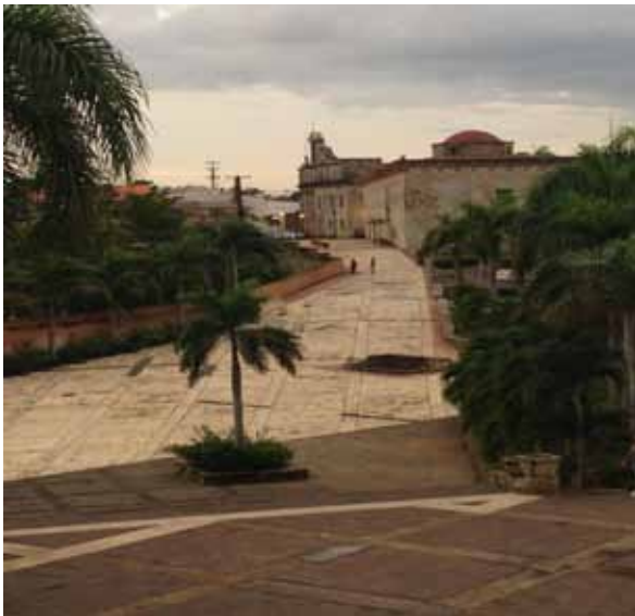
Foto: Vista del Museo de las Casas Reales y del Panteón Nacional,

la Cámara de Diputados (178 Representantes), y del Senado (32 Senadores), pero establece la unificación de las elecciones legislativas y presidenciales (las próximas se celebrarán en mayo de 2016 ) impidiendo en todo caso la reelección presidencial consecutiva.