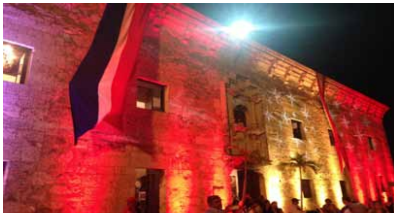
Foto: Museo de Las Casa Reales durante Las Semanas de España, octubre 2014