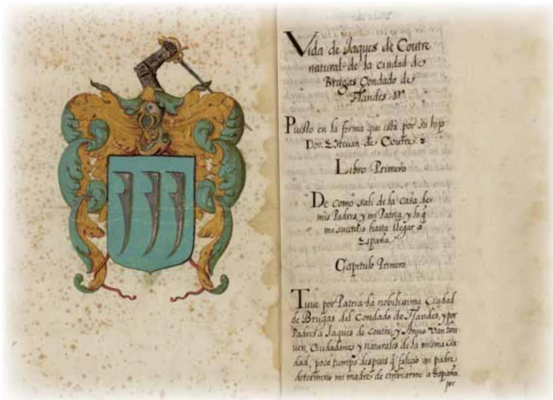
«Vida de Jacques de Coutre», Biblioteca Nacional de España, Madrid. MSS/2780