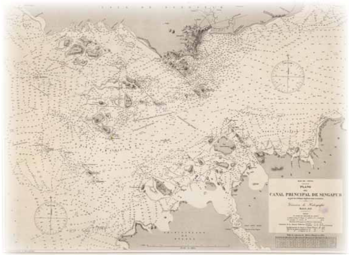
«Plano del Canal Principal de Singapur», Biblioteca Nacional de España, Madrid. MR/22 H. 0726