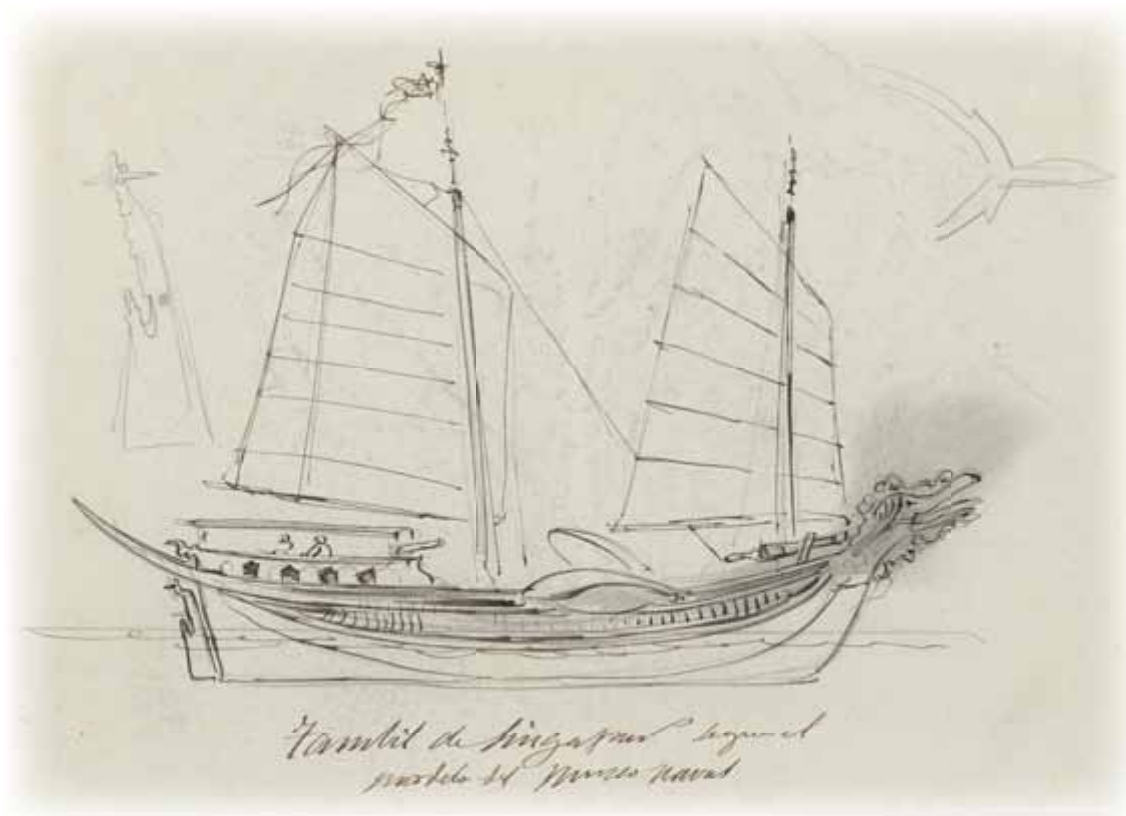
«Tambil de Singapur», Biblioteca Nacional de España, Madrid. DIB/14/40/391