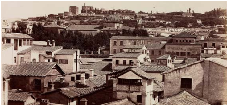
Granada, vista de la Alhambra desde la ciudad.