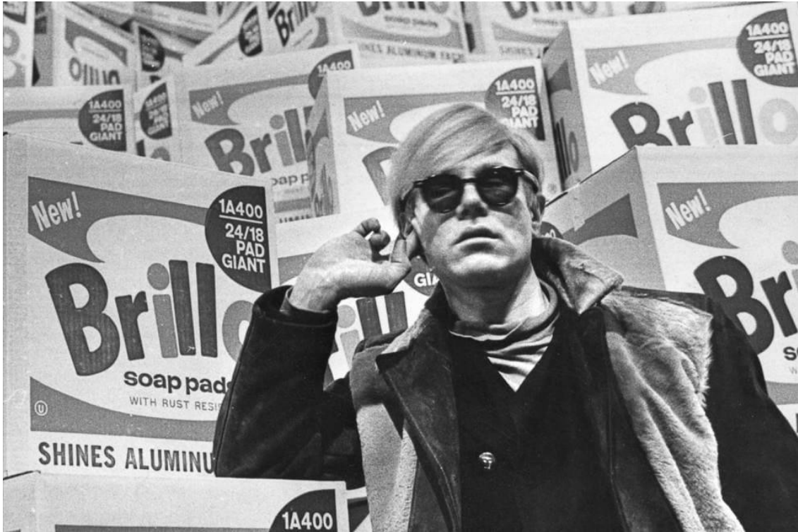
Andy Warhol

Moderna Museet continúa sus visitas guiadas en español por el experto Miguel Cobos. Debido al gran éxito, se ofrecen ahora dos visitas al mes. Este mes de octubre serán los siguientes sábados, como de costumbre a las 14.00: