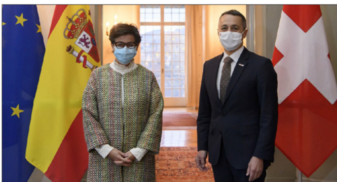
La anterior ministra de Asuntos Exteriores, Unión Europea y Cooperación es recibida en la Maison de Watteville por el entonces consejero Federal Ignazio Cassis .- Berna, 20 de noviembre de 2020.

15/16-02-2016, asistencia en Ginebra de la defensora del Pueblo, Dª Sole-