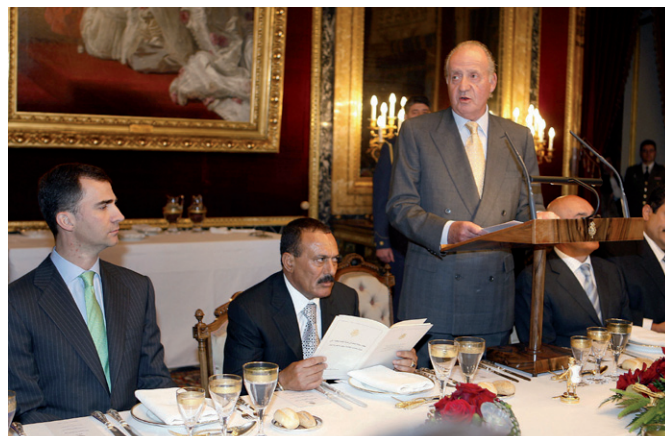
S.M. el Rey Juan Carlos en el almuerzo ofrecido al entonces presidente de Yemen, Ali Abdullah Saleh, de visita oficial a España en enero de 2008.

Entre los años 1979-1983 fue designado Decano de la Facultad de Ciencias de la Universidad de Saná y Decano de la Facultad de Medicina de la Universidad de Saná 1982 -1987, y Vice-Rector de la Universidad de Saná 1982 -1993. En