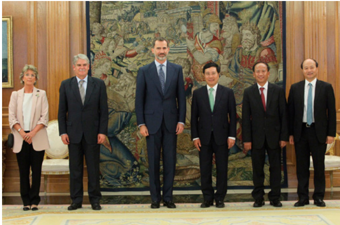
Su Majestad el Rey con el vice primer ministro y ministro de Asuntos Exteriores de la República Socialista de Vietnam, Pham Binh Minh, y las delegaciones de ambos países.- Palacio de La Zarzuela. Madrid, 23.05.2017.