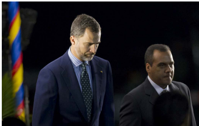
El entonces príncipe de Asturias, Felipe de Borbón, es recibido en Caracas por el exviceministro de Exteriores venezolano, Temir Porras, con motivo de las exequias al presidente Hugo Chávez, en marzo de 2013.