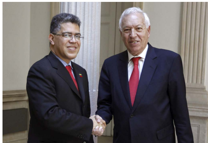
El anterior anterior Ministro de Asuntos Exteriores y Cooperación, José Manuel García-Margallo, junto al ex ministro de Asuntos Exteriores de Venezuela, Efraín Escobar, durante una visita realizada a Madrid en junio de 2013 © FOTO EFE.

Ante esta crisis y bajo los auspicios de UNASUR, por un lado, Gobierno y, por otro, oposición y organizaciones empresariales iniciaron un diálogo para aplacar las protestas y tratar de resolver la difícil situación económica. El debilitamiento de las protestas y la falta de acuerdo entre las partes llevaron a la suspensión del proceso de diálogo, que apenas duró dos meses.