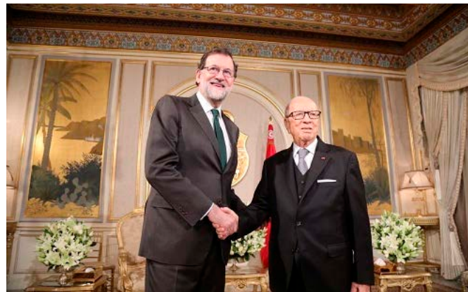
Mariano Rajoy, anterior Presidente de Gobierno, junto al presidente de la República Tunecina, Béji Caïd Essebsi.- en Túnez, febrero 2018.

No hay nada que señalar a este respecto.