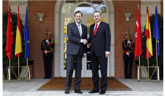
El primer ministro de Turquía, Recep Tayyip Erdoğan, junto al presidente del gobierno, Mariano Rajoy, durante su visita al Palacio de la Moncloa en noviembre de 2012.

El estallido de la denominada “primavera árabe” en 2011 y de modo especial la revuelta popular en Siria contra el régimen de Bashar al-Asad supuso un importante reto para la política exterior turca. Turquía intentó ejercer en un primer momento un papel de mediador entre el régimen sirio y los opositores. Poste-