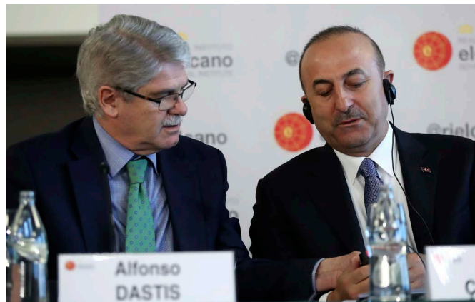
Ministro de Asuntos Exteriores y de Cooperación D. Alfonso Dastis conversa con su homólogo Mevlut Cavusoglu. Febrero 2017.