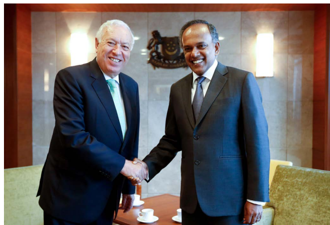
José Manuel García-Margallo, anterior ministro de Asuntos Exteriores y de Cooperación, junto al entonces ministro de Asuntos Exteriores K. Shanmugam, durante su visita a Singapur en noviembre de 2013. © EFE..

Fuente: SINGSTAT (no existen datos disponibles de 2015)