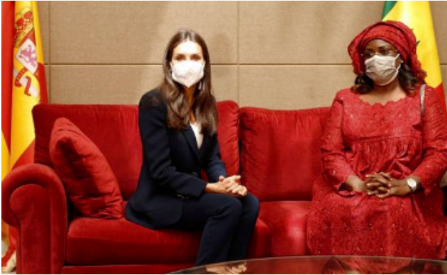
Con motivo del viaje a Senegal, encuentro entre SM la Reina Letizia y la primera dama del país, Marie Faye Sall.- 15 diciembre 2021.

Septiembre 2019: MAESE, Amadou Ba viajó a Madrid para las 2ª consultas políticas bilaterales