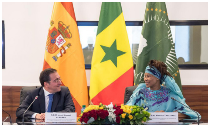
Encuentro entre el Ministro de Asuntos Exteriores, UE y Cooperación, José Manuel Albares, y su homóloga senegalesa, Aïssata Tall Sall –Senegal 21/07/2022

Sr. Moussa Bocar Thiam: Ministro de Comunicación, telecomunicaciones y economía digital