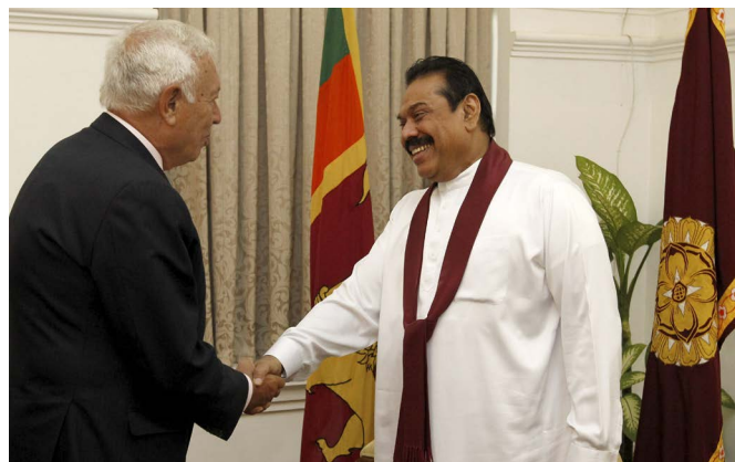
El anterior ministro de Asuntos Exteriores y de Cooperación saluda al entonces presidente de la República de Sri Lanka, Mahinda Rajapaksa, durante su visita a Colombo, en septiembre de 2014.