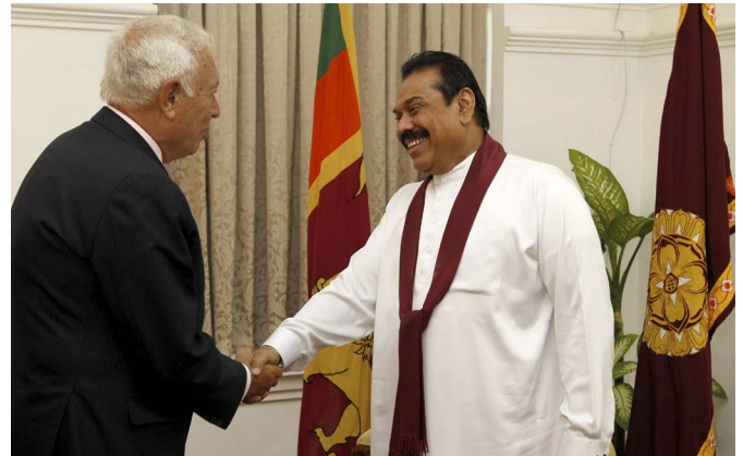
El ministro de Asuntos Exteriores y de Cooperación saluda al presidente de la República de Sri Lanka, Mahinda Rajapaksa, durante su visita a Colombo, en septiembre de 2014.