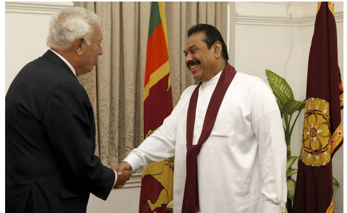
El anterior ministro de Asuntos Exteriores y de Cooperación saluda al entonces presidente de la República de Sri Lanka, Mahinda Rajapaksa, durante su visita a Colombo, en septiembre de 2014.