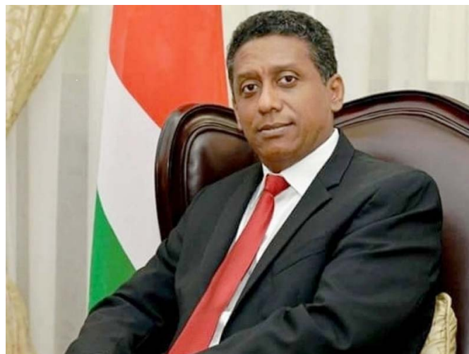
Danny Faure, Presidente de la República de Seychelles

Fue nombrado Ministro de Asuntos Sociales y Empleo en enero de 2004. También