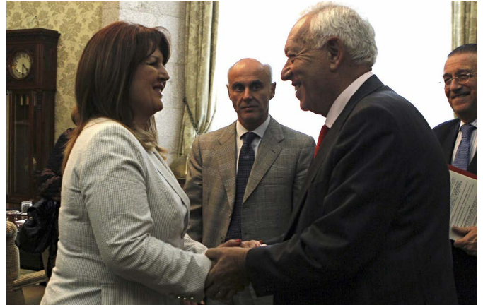
El anterior ministro de Asuntos Exteriores y de Cooperación, José Manuel García-Margallo, saluda a la entonces viceprimer ministra de Serbia, Suzana Grubjesic durante su visita a Madrid en mayo de 2013.