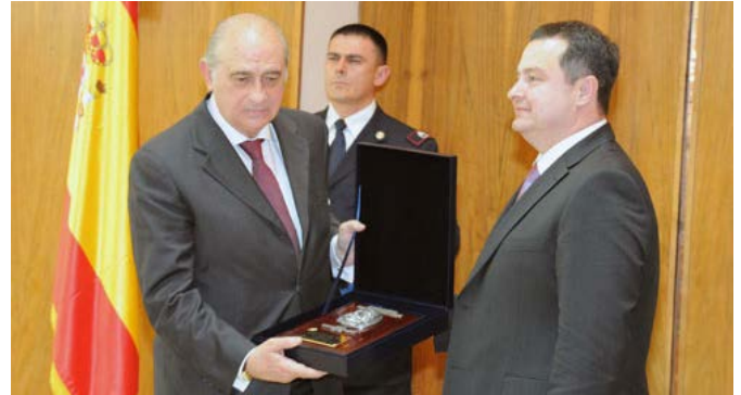
El anterior ministro del Interior, Jorge Fernández Díaz, es condecorado por su homólogo serbio en marzo de 2012, tras la detención en España del responsable del asesinato del primer ministro de Serbia en 2003.

17-5-2005 Canje de notas por el que se mantienen en vigor entre España y Serbia y Montenegro diversos Acuerdos bilaterales concluidos entre España y la antigua República Socialista Federal de Yugoslavia. Entrada en vigor el 20-12-2005.