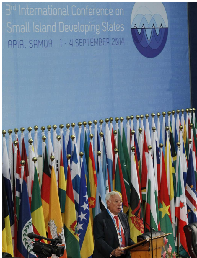
El anterior ministro de Asuntos Exteriores y de Cooperación, José Manuel García-Margallo durante la visita a Apia (Samoa) en septiembre de 2014, con motivo de la Conferencia de la ONU de los Pequeños Estados Insulares en Desarrollo.