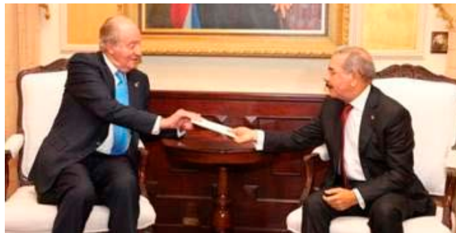
Su Majestad El Rey Juan Carlos I entregando la carta de felicitación del Rey Felipe VI al Presidente Danilo Medina, con motivo de la toma de posesión del segundo mandato.- Santo Domingo 16 de agosto 2016

La exportación española presenta un nivel estandarizado en torno a los 200-300 millones de euros anuales. En los dos últimos años, sin embargo, saltó a 547 millones EUR (un 20% en 2016), salto motivado principalmente por una venta puntual de combustibles. Ello unido al estancamiento de las ventas dominicanas, sitúa la tasa de cobertura favorable a España en 400%. La cuota de mercado