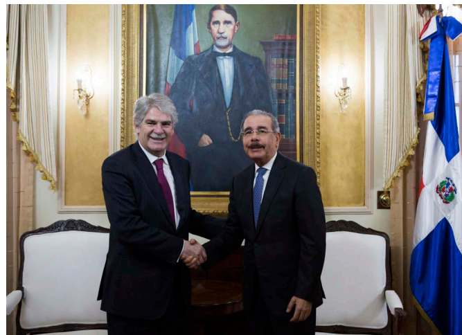
El presidente dominicano, Danilo Medina saluda al ministro español de Asuntos Exteriores, Alfonso Dastis durante un encuentro en el Palacio Nacional tras la conmemoración del XII aniversario del Fondo Sica-España.- 14 de marzo de 2018, en Santo Domingo (República Dominicana).- @EFE/Orlando Barria