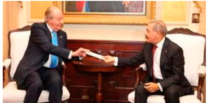
Su Majestad El Rey Juan Carlos I entregando la carta de felicitación del Rey Felipe VI al Presidente Danilo Medina, con motivo de la toma de posesión del segundo mandato.- Santo Domingo 16 de agosto 2016

El número de ciudadanos dominicanos registrados en España es de 160.000, los cuales remiten anualmente más de 740 millones de euros a sus familias (datos de 2016). La Cámara de Comercio Oficial Española es activa e importante y cuenta con más de 400 empresas afiliadas. También son numerosos los viajes oficiales y de negocios en ambas direcciones. El número anual de turistas españoles se acerca a 170.000 según datos de 2016. El comercio agregado de mercancías supera 550 millones de euros con la exportación española multiplicando por cinco a la importación. El fondo de inversiones españolas en el país es significativo y destacan sectores como complejos hoteleros de playa y ciudad, inmuebles, generación eléctrica, seguros, servicios hospitalarios, seguros de seguridad y a empresas, producción de cemento, casinos y sociedades diversas.