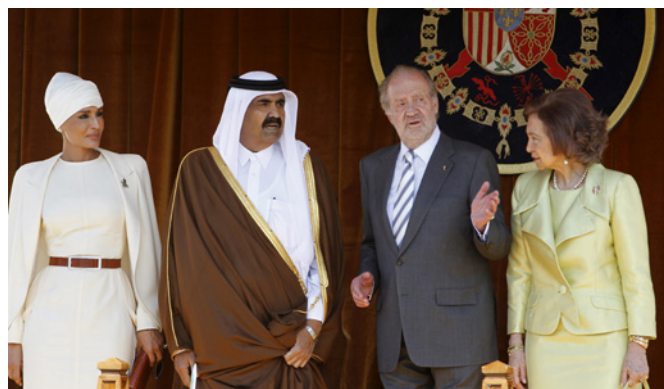
Los Reyes de España, junto al Emir de Catar y su esposa, durante la visita oficial que realizaron a España en abril de 2011.

Por otro lado, el Ministerio de Asuntos Administrativos, Trabajo y Asuntos Sociales ha aprobado en julio de 2020 un borrador de decisión por el que pretende regular el porcentaje de cataríes respecto a extranjeros en determinados puestos del sector privado. Además, esta propuesta de decisión contempla elevar la ratio al 60% de trabajadores cataríes en el caso de organismos gubernamentales y hasta el 80% en los departamentos de RRHH en estas empresas públicas.