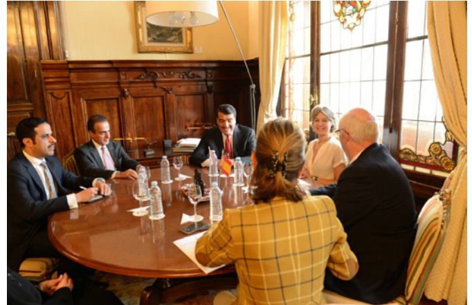
SE el anterior ministro de Municipalidad y Medioambiente catarí, Abdullah Al Rumaihi, visitó España, manteniendo un encuentro con la anterior Ministra de Agricultura, Pesca, Alimentación y Medio Ambiente, Dª Isabel García Tejerina. Madrid, 10 de mayo de 2017.