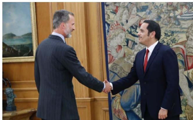
SM el Rey recibe el saludo del vice primer ministro y ministro de Asuntos Exteriores del Estado de Catar, su excelencia el Jeque Mohammed Bin Abdulrahman Al-Thani.- Palacio de La Zarzuela. Madrid, 13.09.2018.

La exportación española está diversificada y depende del ciclo de la construcción catari. En la medida en que Catar se encuentra en la fase final del ciclo, las exportaciones con más peso como aparatos mecánicos y eléctricos caen en 2019, mientras que suben fuertemente otros como trenes, betún para muebles o cárnicos. Los principales capítulos en 2019 según peso en la exportación han sido: prendas de vestir por la importante presencia de Inditex, Cortefield y Mango (de punto y no: 12,3%), máquinas y aparatos mecánicos (8,7%; aunque se reducen a la mitad en 2019), manufacturas de fundición - hierro y acero (7,4%) y muebles, sillas y lámparas (7%). Las importaciones están fuertemente concentradas en un 93% en el capítulo de combustibles (fundamentalmente gas natural licuado) siendo prácticamente el 7% restante derivados del petróleo, como manufacturas plásticas y productos químicos orgánicos.