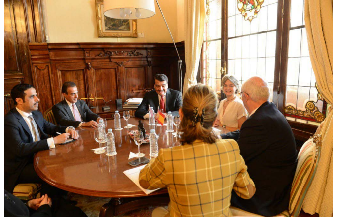
Encuentro del Ministro de Municipalidad y Medio Ambiente de Catar Mohamed Al Rumaihi con la Ministra de Agricultura, Pesca, Alimentación y Medio Ambiente, Isabel García Tejerina. Madrid, 10 de Mayo de 2017