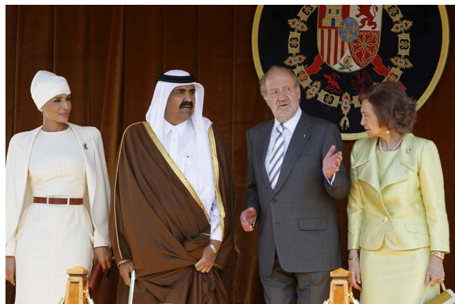
Los reyes de España, junto al emir de Catar y su esposa, durante la visita oficial que realizaron a España en abril de 2011.