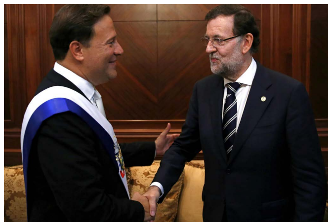
El presidente del Gobierno, Mariano Rajoy, saluda al presidente de Panamá, Juan Carlos Varela, en su toma de posesión en julio de 2014.

La Constitución política de la República de Panamá, promulgada en 1972 y enmendada en 1983, establece como forma de Estado la República Presidencialista