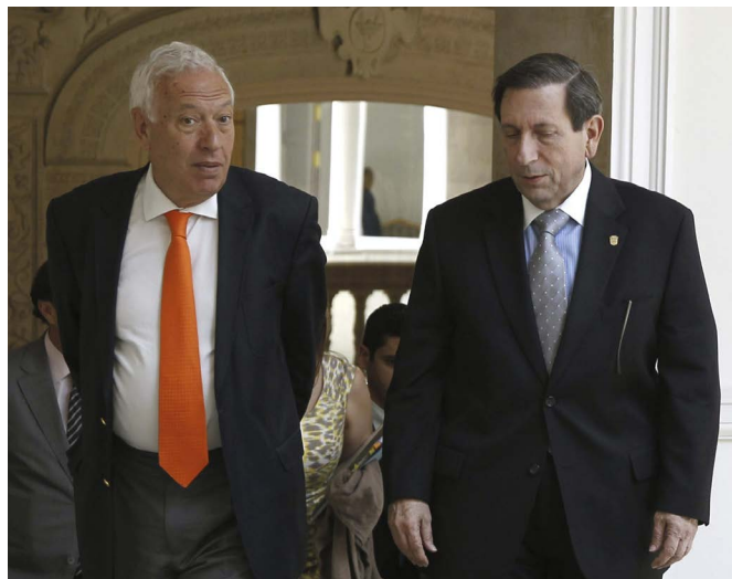
El entonces ministro de Asuntos Exteriores y de Cooperación, José Manuel García-Margallo, junto a entonces homólogo panameño, Fernando Núñez Fábrega, durante su visita a Madrid en julio de 2013.

La política exterior panameña se ha caracterizado tradicionalmente por una línea de neutralidad y una capacidad de interlocución con actores variados en la