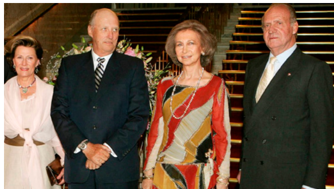
Visita a Oslo de SSMM Don Juan Carlos y Doña Sofía con motivo del 80º aniversario de los reyes de Noruega Harald y Sonia. Oslo, 10 de mayo de 2017

Adicionalmente, las estructuras de promoción de estos festivales facilitan,