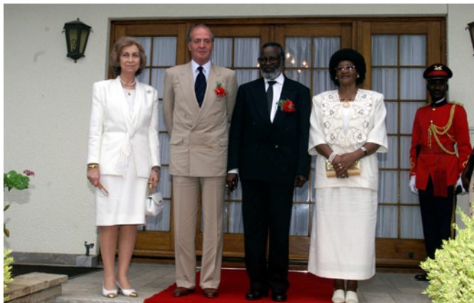
SS.MM. los reyes de España junto al entonces presidente de Namibia, San Nujoma, y su esposa, durante la visita de Estado que realizaron a Namibia en febrero de 1999.