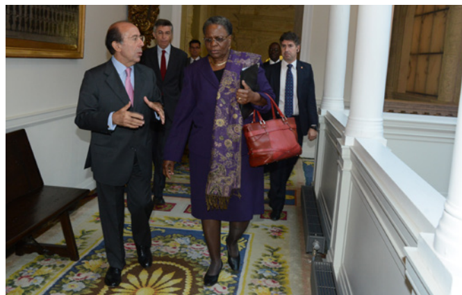
El entonces secretario de Estado de Asuntos Exteriores, Gonzalo de Benito, junto a la ministra de Asuntos Exteriores de Namibia, Netumbo Nandi-Ndaitwah, durante su visita a Madrid en octubre de 2013.

Ministro de Industrialización, Comercio y Desarrollo de Pequeñas y Medianas