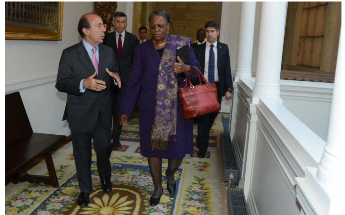
El entonces secretario de Estado de Asuntos Exteriores, Gonzalo de Benito, junto a la ministra de Asuntos Exteriores de Namibia, Netumbo Nandi-Ndaitwah, durante su visita a Madrid en octubre de 2013.

Ministro de Minas y Energía: Sr. Tom Alweendo