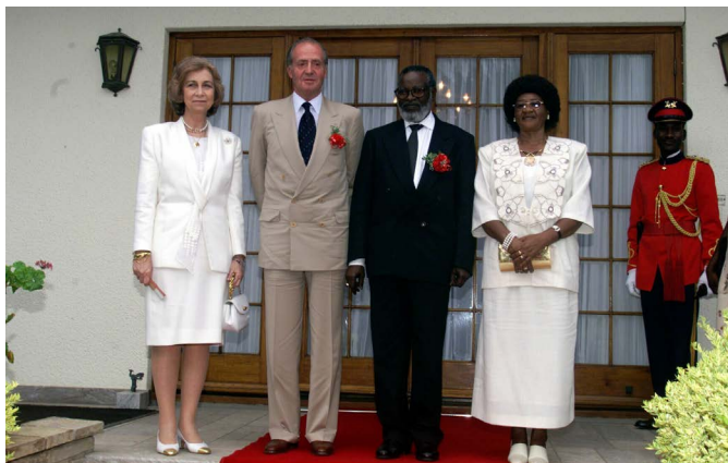
SS.MM. los reyes de España junto al entonces presidente de Namibia, San Nujoma, y su esposa, durante la visita de Estado que realizaron a Namibia en febrero de 1999.

Desde el 21 de marzo de 2015, además de Ministra de Relaciones Internacionales, ostenta el cargo de Viceprimera Ministra y en el Congreso de la SWAPO celebrado en noviembre de 2017 resultó elegida Vicepresidenta del partido.