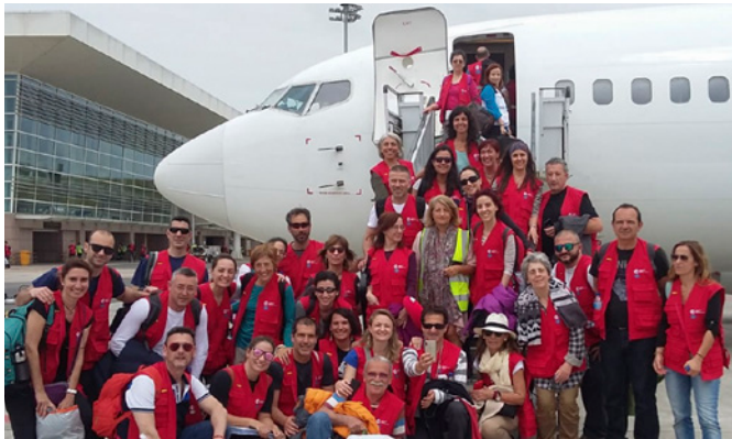
La Embajadora de España en Mozambique recibiendo en Maputo a los primeros integrantes del hospital español START en auxilio a las víctimas del ciclón Idai el 30 de marzo de 2019.