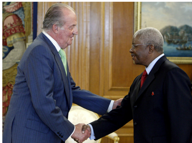
El rey Juan Carlos saluda al anterior presidente de Mozambique, Armando Guebuza, durante su visita a España en octubre de 2010.

El V Plan Director reitera el papel prioritario de Mozambique y actualmente se está discutiendo con las autoridades mozambiqueñas y todos los actores