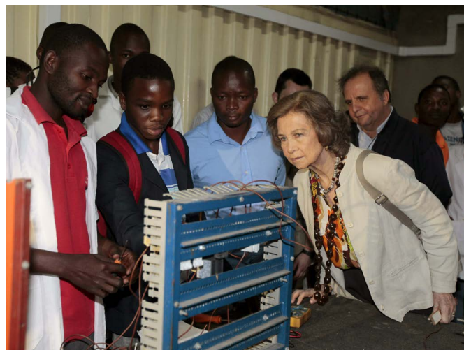
La reina doña Sofía, durante la visita a varios proyectos financiados por la Cooperación Española, en Maputo en abril de 2013.

Desde finales de los años ochenta la política macro-económica de Mozambique ha venido definida por las relaciones mantenidas con el Banco Mundial y el FMI, que aseguran un importante flujo de donaciones y financiación concesional a cambio de ajustarse a las recomendaciones contenidas en los programas elaborados por estos organismos. A finales de 2015 el FMI aprobó un préstamo de 282.9 millones de dólares para ayudar a Mozambique a corregir sus desequilibrios. El 18 de enero de 2016 un nuevo informe del FMI subrayó que la deuda externa de Mozambique se ha situado cerca del nivel de insostenibilidad (40% del PIB en 2015 frente a 30% en 2014) por lo que solicita a este país que adopte medidas fiscales y monetarias cuanto antes. El FMI apunta a desviaciones en la