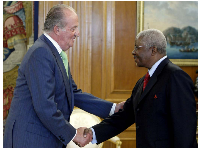
El rey Juan Carlos saluda al presidente de Mozambique, Armando Guebuza, durante su visita a España en octubre de 2010.

- Convenio Básico de Cooperación Científica y Técnica (diciembre de 1980), que sirve de base jurídica general a las relaciones bilaterales de cooperación, así