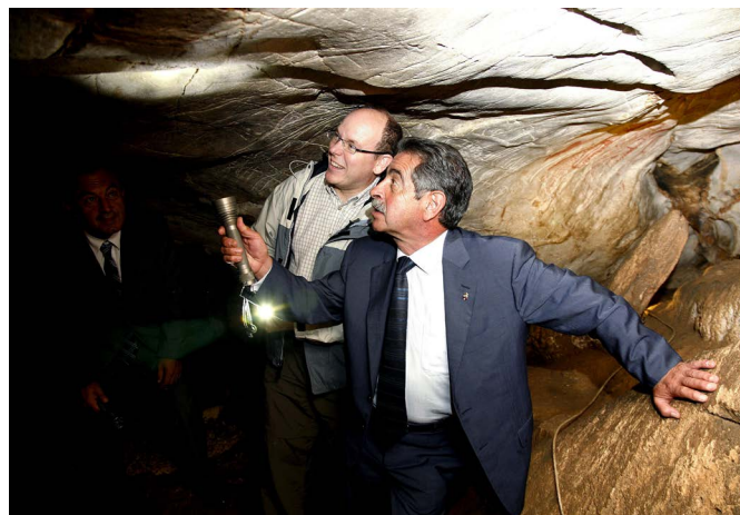
El príncipe Alberto de Mónaco junto al presidente de Cantabria Miguel Ángel Revilla, durante la visita a los grabados prehistóricos de la cueva del Castillo, un yacimiento excavado a comienzos del siglo XX con el mecenazgo del tatarabuelo del príncipe monegasco.- Octubre 2010.

En 1876, el rey Alfonso XIII autorizó la creación de una legación del Principado de Mónaco en Madrid. Desde entonces, el Principado mantuvo ininterrumpidamente su representación en la capital de España hasta que, en la década de los años 30 y como consecuencia primero de la guerra civil española y después de la guerra mundial, la legación se cerró.