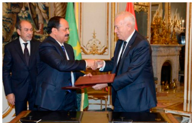
El entonces ministro de Asuntos Exteriores y de Cooperación, José Manuel García-Margallo, saluda a su anterior homólogo mauritano, Hamadi Ould Meimou, durante su visita a Madrid en noviembre de 2015.

España es un país de gran importancia económica para Mauritania, habiéndose consolidado en los últimos años entre los primeros socios tanto como