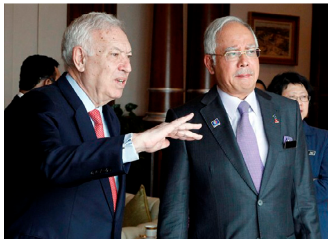
El anterior ministro de AA.EE y de Cooperación José Manuel García-Margallo, junto al entonces primer ministro de Malasia, Najib Razak, durante su visita a Kuala Lumpur en marzo de 2014.

Es aficionado al deporte habiendo liderado al Equipo de Polo Real de Pahang en el campeonato internacional del Club de Polo de Windsor, Inglaterra. También ha participado en torneos de polo en Singapur, Filipinas, Brunei, Argentina, Estados Unidos, España y Bélgica. Estuvo al frente de la Asociación Malasia de Fútbol entre 2014 y 2017. En el Estado de Pahang fundó su propio equipo de fútbol llamado Sri Mahkota Alam in Pekan.