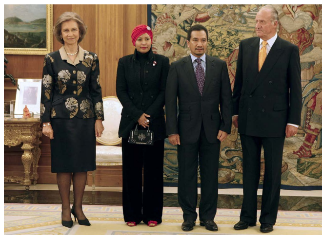
SS MM los reyes de España, junto a SS MM los reyes de Malasia, durante la visita oficial que realizaron a España, en octubre de 2008.

Los Estados de la Federación tienen cada uno una Asamblea legislativa elegida por sufragio universal (también circunscripciones uninominales) y un gobierno encabezado por un ministro principal. En Malasia, organizada políticamente como Estado federal, el poder del centro es decisivo y su grado de descentralización es inferior al de España, atendiendo a su reparto competencial.