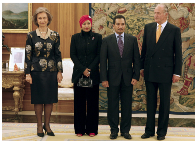
SS MM los reyes de España, junto a SS MM los reyes de Malasia, durante la visita oficial que realizaron a España, en octubre de 2008.