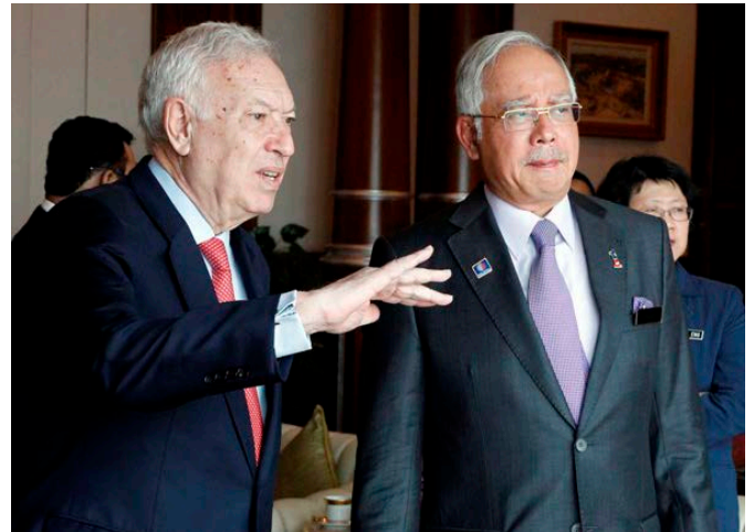
El anterior ministro de AA.EE y de Cooperación José Manuel García-Margallo, junto al primer ministro de Malasia, Najib Razak, durante su visita a Kuala Lumpur en marzo de 2014.

Malasia desarrolla un papel como facilitador en el conflicto de Mindanao entre la guerrilla del Frente Moro de Liberación Islámica ( MILF) y el Gobierno de Filipinas y en Tailandia en el conflicto separatista en las provincias del sur de Tailandia entre el Gobierno tailandés y el grupo Barisan Revolusi Nasional (BRN, Frente Revolucionario Nacional).