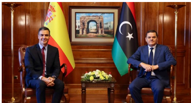
Foto del servicio de prensa del primer ministro libio, muestra al presidente del Gobierno español, Pedro Sánchez con su homólogo libio, Abdulhamid Dbeibah durante su encuentro en Trípoli.-3 de junio de 2021. EFE/EPA/Libyan Prime Minister Media Office / HANDOUT HANDOUT EDITORIAL USE ONLY/NO SALES

diversos procesos de diálogo y reconciliación nacionales.