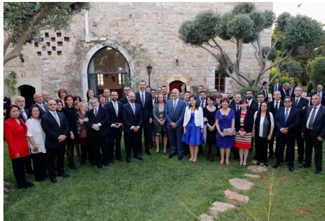
Su majestad el rey Felipe VI, con motivo del viaje al Líbano, en un encuentro mantenido con una representación de la colectividad española.- Beirut (Líbano), 07.04.2015.

El Libano es Estado miembro de las principales organizaciones internacionales que pertenecen al sistema de Naciones Unidas, así como de organizaciones financieras internacionales como el Fondo Monetario Internacional y el Banco Mundial. Libano ha solicitado su ingreso en la OMC, donde tiene estatuto de país observador desde 1999. En cuanto a las organizaciones regionales, Libano es miembro de la Liga Árabe. También forma parte del “GAFTA” (Gran Zona Árabe de Libre Comercio), a la que pertenecen 18 países árabes y cuyo objetivo es establecer un Mercado Común Árabe.