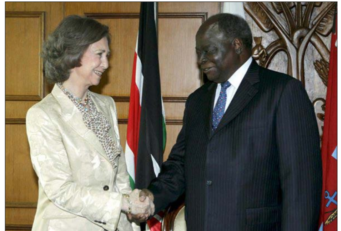
S.M. la Reina Doña Sofía, saluda al Presidente de Kenia, Mwai Kibaki, durante su visita al país en 2010 en el marco de la Cumbre Regional del Microcrédito para África y Oriente Medio.

La deuda pública externa se sitúa en 20.722 M USD en 2016, lo que representa un 29,5% del PIB. Kenia se benefició en 2004 de una reestructuración de la deuda del Club de París y sus bajos niveles de deuda impidieron su inclusión en el marco de la iniciativa HIPC.