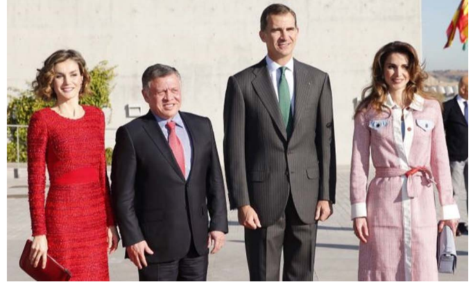
SS MM los reyes de España junto a SS.MM los reyes del Reino Hachemita de Jordania tras su llegada a Madrid en Visita de Trabajo.-19/11/2015.

Pese a los conflictos que vienen sufriendo los países vecinos y la necesidad de re-