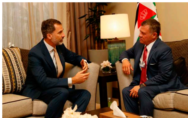
SM el rey de España junto con SM el rey de Jordania durante un encuentro mantenido en Amán en mayo de 2017.