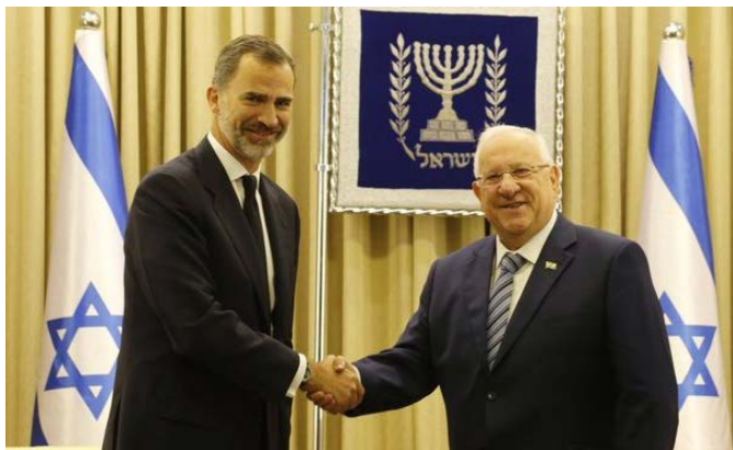
Don Felipe VI saluda al presidente de Israel, Reuven Rivlin durante su viaje Israel con motivo del funeral por Simón (Septiembre 2016)

1992. En 1996 fue elegido de nuevo diputado de la Knesset por el mismo partido. Fue nombrado Ministro de Comunicaciones en 2001 en el Gobierno de Ariel Sharon. En 2003 fue elegido Presidente de la Knesset. En 2007 se presentó a las elecciones presidenciales, que perdió contra Shimon Peres. En 2009 fue elegido de nuevo Presidente de la Knesset, cargo que mantuvo hasta el año 2013.