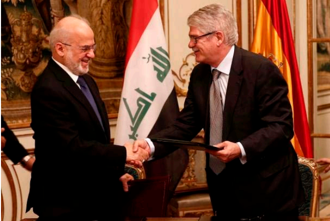
Encuentro entre Alfonso Dastis, ministro de Asuntos Exteriores y de Cooperación y el ministro de Asuntos Exteriores, Al Jaafari.- Mayo 2017 en Madrid.-

Oficina para la Coordinación de Asuntos Humanitarios (OCHA).