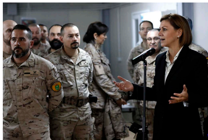
La ministra de defensa, D a María Dolores de Cospedal, durante su visita a las tropas españolas de misión en Irak. - diciembre 2016.