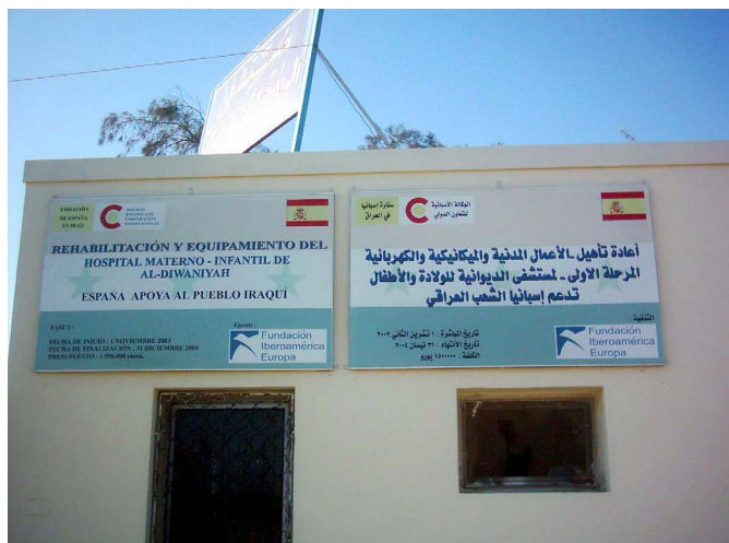
Imagen de 2004, del hospital materno-infantil de Diwaniya financiado por la Agencia Española de Cooperación Internacional para el Desarrollo.

Ministro de Kurdistán. En 2003, tras la invasión de Irak, Masum regresó a Bagdad para ser miembro de la delegación que representó el Kurdistán, y fue miembro del comité de redacción de la Constitución. En 2010, Masum convirtió en Presidente del Consejo de Representantes. En 2014, fue elegido por los representantes parlamentarios como el séptimo presidente de Irak.