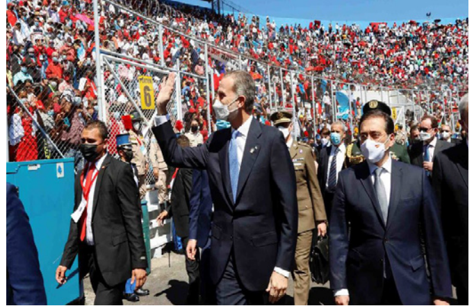
El rey Felipe VI de España, acompañado por el ministro de Asuntos Exteriores José Manuel Albares, asiste a la investidura de Xiomara Castro como presidenta de Honduras.

Agencia Andaluza de Cooperación Internacional al Desarrollo (AACID): Ha venido impulsando diferentes intervenciones dirigidas a los sectores más vulnerables con el objetivo de promover los procesos de desarrollo humano integral. Tiene ejecución bilateral siendo su principal socio DICTA de la Secretaría de Agricultura y Ganadería (SAG). En 2019 financió proyectos de ONGs en Honduras por un monto de 1.720.334€, siendo algunos de ellos regionales. Los principales temas fueron género, Derechos Humanos y desarrollo rural. En 2019, con un monto total de 0,75 M€ se apoyaron también los proyectos de Fortalecimiento de las capacidades institucionales para la implementación de la nueva agenda urbana en Honduras por la Municipalidad de Comayagua y Fortalecimiento de la productividad y competitividad rural con la Dirección de Ciencia y Tecnología Agropecuaria (DICTA).