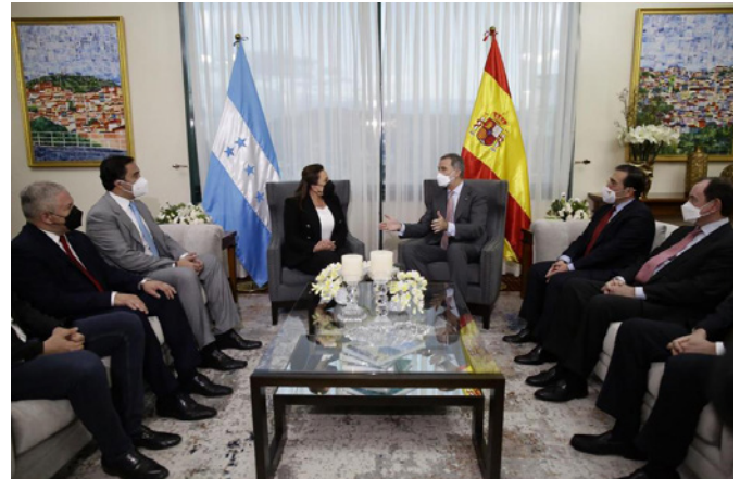
Xiomara Castro recibe a Su Majestad y al ministro de Exteriores, horas antes de tomar posesión como la primera presidenta mujer del país hondureño

Las relaciones institucionales actualmente son buenas y estables y se mantienen contactos entre las autoridades de forma regular. En agosto de 2020 se firmó un Memorando de Entendimiento entre el Ministerio de Asuntos Exteriores, Unión Europea y Cooperación del Reino de España y la Secretaría de Relaciones Exteriores y Cooperación Internacional de la República de Honduras, auspiciando el establecimiento de un Mecanismo de Consultas Políticas. Los días 27 y 28 de mayo de 2021 el canciller Lisandro Rosales visitó Madrid a la cabeza de una delegación integrada, entre otros, por el