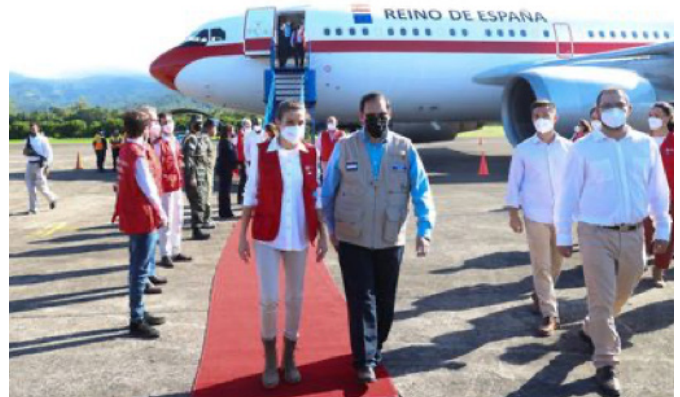
La Reina Doña Letizia y el canciller de Honduras, Lisandro Rosales, a su llegada a Honduras.- 14 de diciembre de 2020.

26 y 27 de enero de 2022 S.M. el Rey acudió, acompañado por el Ministro de Asuntos Exteriores José Manuel Albares, a la toma de posesión de la Presidenta Xiomara Castro. S.M. el Rey tuvo ocasión de reunirse con el Presidente y otros miembros del Gobierno saliente, así como con la nueva Presidenta y cargos de su Gobierno.