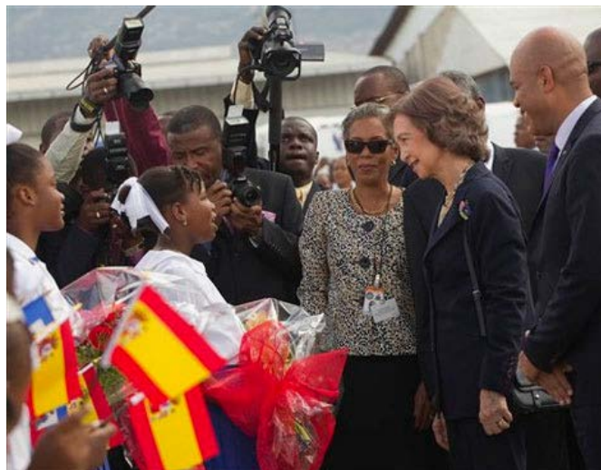
La reina Doña Sofía a su llegada a Haití junto al presidente del país, Michel Martelly, en su visita en octubre de 2011

Las relaciones comerciales entre Haití y los EEUU están dominadas por la importación haitiana de productos básicos como el arroz y las facilidades de exportación al textil haitiano ofrecidas por los americanos. En diciembre de 2006 el Congreso de EEUU aprobó la ley HOPE ( Haitian Hemispheric Opportunity through Partnership Encouragement Act ) que permite a Haití exportar productos textiles y cables sin aranceles ni cuotas a los EEUU. En mayo de 2008 el Congreso aprobó la extensión de la aplicación de la ley hasta 2018 (HOPE II) y de nuevo, en mayo de 2010, se aprobó la ley HELP ( Haiti Economic Lift Program ) que prevé la aplicación de la ley HOPEII y el acuerdo CBTPA ( Caribbean Basin Trade Partnership Act ) hasta septiembre del año 2020.