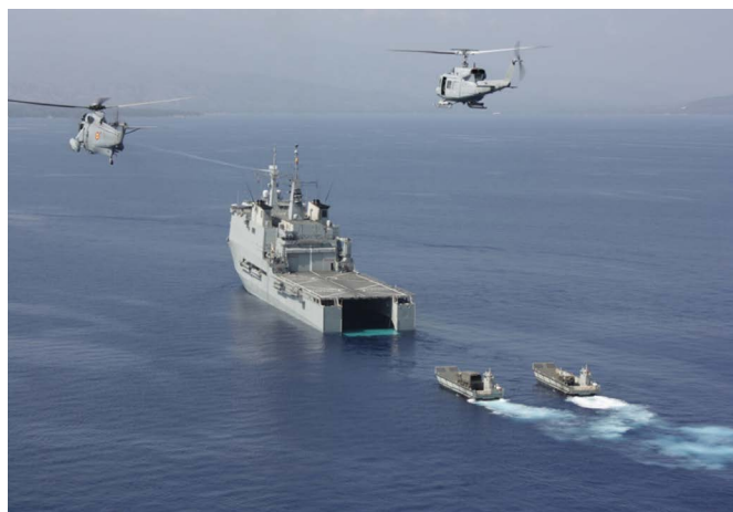
El Buque-Hospital 'Castilla'; a su llegada a Haití, tras el terremoto de 2010

República Dominicana. Las relaciones están canalizadas a través de la Comisión Binacional de Alto Nivel. El buen comienzo de su relanzamiento se vio ensombrecido por los efectos de la sentencia 168-13 de la Corte Constitucional dominicana, por la que miles de haitianos de origen se verían privados de la nacionalidad dominicana. Sin embargo, ambos gobiernos han sabido trabajar conjuntamente en ámbitos de interés compartido utilizando la Comisión Binacional de Alto Nivel como herramienta de trabajo. En el último año se han estrechado las relaciones, y el Presidente electo haitiano, Jovenel Moïse, ha visitado en enero de 2017 a su homólogo dominicano Danilo Medina a solo tres semanas de su investidura en Puerto Príncipe.