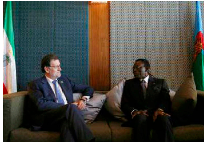
El jefe del Gobierno español, Mariano Rajoy (i) y el de Guinea Ecuatorial, Teodoro Obiang, reunidos en Malabo, durante la cumbre de la Unión Africana, en junio de 2014.