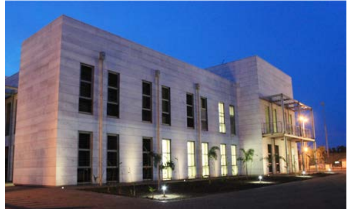
Imagen del nuevo edificio de la Embajada de España en Malabo, inaugurado en julio de 2011.

Ministro de Estado de la Presidencia del Gobierno Encargado de la Integra-