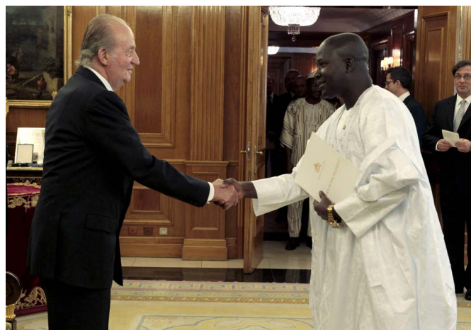
S.M. el rey Juan Carlos recibe las cartas credenciales del nuevo embajador de Gambia en España, Lang Yabou, en el Palacio de Zarzuela, en enero de 2014.

En las elecciones legislativas de 6 de abril de 2017 los partidos de la coalición se presentaron por separado, con los siguientes resultados: